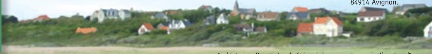
Ambleteuse, Parc naturel régional des caps et marais d'opale

UMR INRA/UAPV n°406 d'écologie des invertébrés, Domaine Saint-Paul, Site Agroparc, 84914 Avignon.